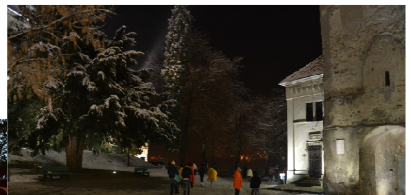
Heilig Abend in Schäßburg