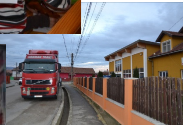
Ein Transport kommt von ORA Österreich mit Lebensmitteln, Hilfsgütern und ... Weihnachtspäckchen!