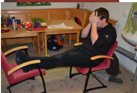
Erster SecondHand-Verkauf - Winterbasar