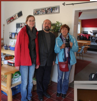
Wir bekommen Besuch im November und Dezember