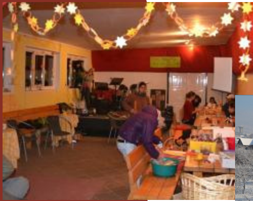
Adventsbasteln im Jugendhaus - nun wird es bei uns gemütlich!